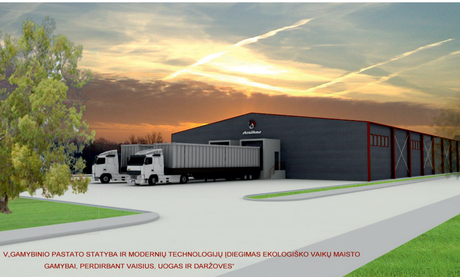
V. „GAMBYBINIO PASTATO STATYBA IR MODERNIŲ TECHNOLOGIJŲ ĮDIEGIMAS EKOLOGIŠKO VAIKŲ MAISTO GAMYBAI, PERDIRBANT VAISIUS, UOGAS IR DARŽOVES“